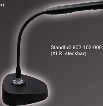
Standfuß 902-102-000 (XLR, steckbar)