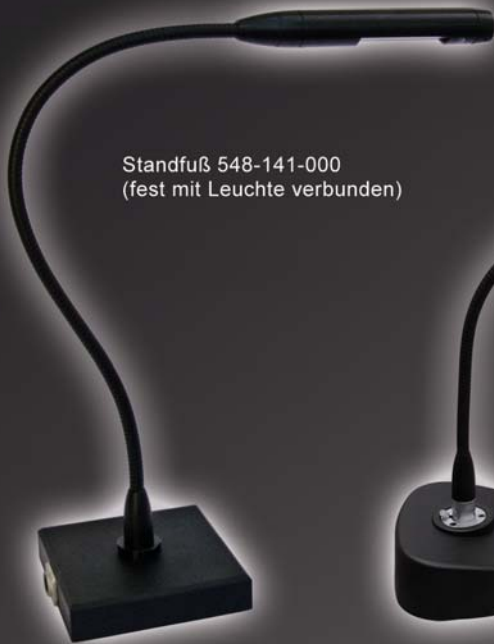
Standfuß 548-141-000 (fest mit Leuchte verbunden)