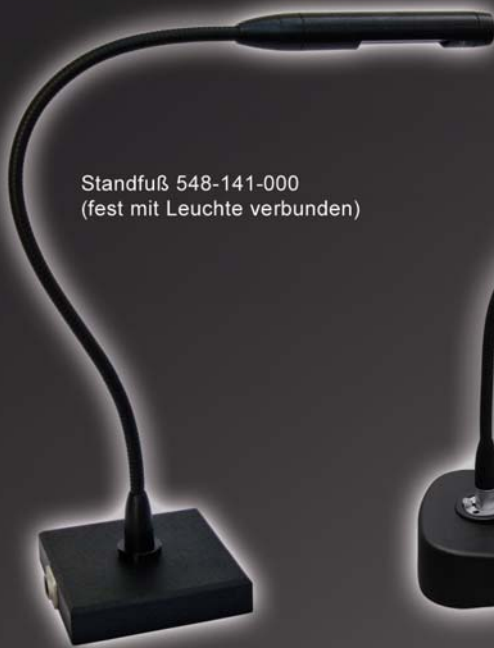
Standfuß 548-141-000 (fest mit Leuchte verbunden)