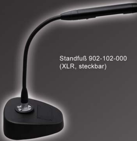
Standfuß 902-102-000 (XLR, steckbar)