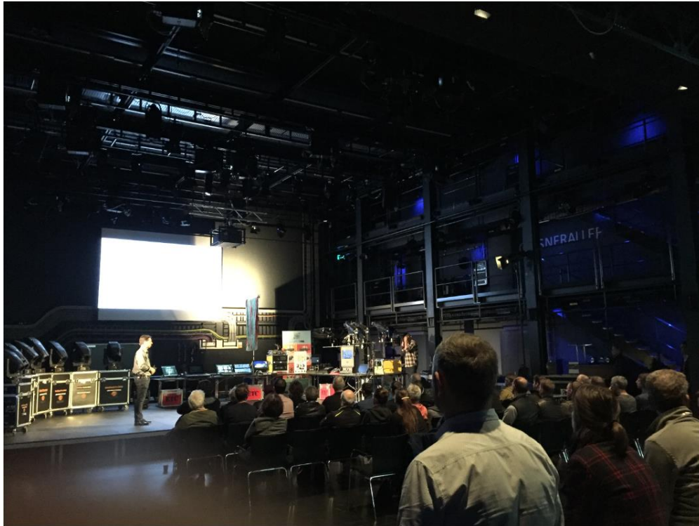
Bildunterschrift: Zahlreiche Fachbesucher sowie Studenten der Hochschule verfolgten die informative Live-Präsentation.