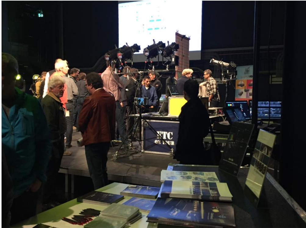
Bildunterschrift: Gelegenheit zum fachlichen Austausch und Hands-on-Test wurde während des gesamten Tages geboten.