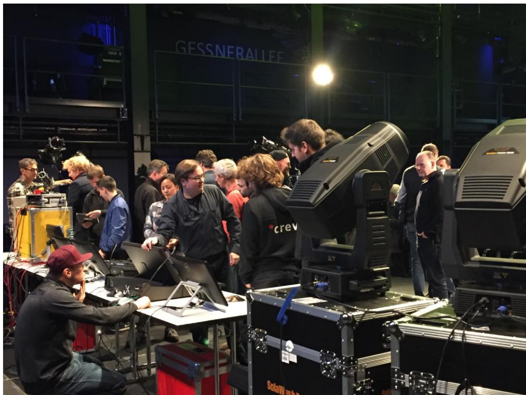
Bildunterschrift: Mitarbeiter von ETC und Preworks beantworteten alle Fragen der Besucher.