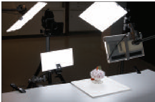
Durch das schmale Profil und den geringen Stromverbrauch ist das LitePad™ eine willkommene Ergänzung für jegliches Film oder TV Set.

Rosco bietet zwei unterschiedliche Dimmer an. Der Einkanal-Dimmer (abgebildet) ist ein kleiner Handdimmer, der zwischen LitePad und Netzteil geklinkt wird. Weiteres Zubehör für LitePad finden Sie auf der Rosco Webseite.